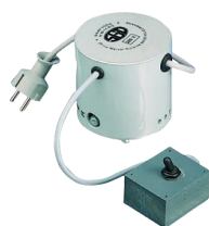
70369 – Pompe seule

Utiliser uniquement des solvants gras et non chlorés