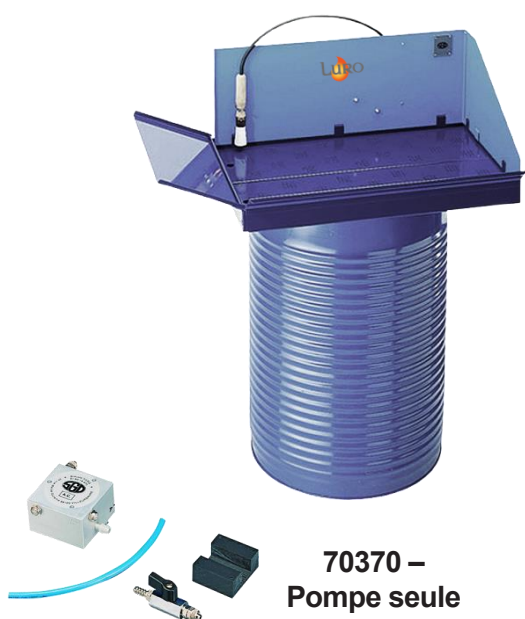
70370 – Pompe seule

Nous déclinons toute responsabilité en cas d'introduction de produits volatils et/ou inflammables tels que: alcool, essence... qui entraîneraient des risques d'explosion et/ou de feux pouvant mettre en danger la vie d'autrui et/ou détruire les biens.